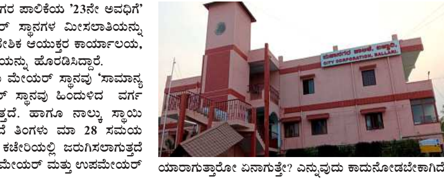
ಯಾರಾಗುತ್ತಾರೋ ಏನಾಗುತ್ತೆ? ಎನ್ನುವುದು ಕಾದುನೋಡಬೇಕಾಗಿದೆ.

ಬಳ್ಳಾರಿ ಮಾ-: ಬಳ್ಳಾರಿ ಮಹಾನಗರ ಪಾಲಿಕೆಯ '23ನೇ ಅಧಿಗ' ಮೇಯರ್ ಮತ್ತು ಉಪಮೇಯರ್ ಸ್ಥಾನಗಳ ಮೀಸಲಾತಿಯನ್ನು ನಗರದಿಶ್ಚರಿಸಲಾಗಿದೆ ಎಂದು ಪ್ರಾಜೇಶಿಕ ಆಯುಕ್ತರ ಕಾರ್ಯಾಲಯ, ಕೆಲಬುರಗಿ ವಿಭಾಗ ಅಧೀನ ಚಿನ್ನಿಯನ್ನು ಹೊರಡಿಸಿದ್ದಾರೆ. ಬಳ್ಳಾರಿ ಮಹಾನಗರ ಪಾಲಿಕೆಯ ಮೇಯರ್ ಸ್ಥಾನವು 'ಸಾಮಾನ್ಯ ವರ್ಗ'(ಪುರುಷ), ಉಪ-ಮೇಯರ್ ಸ್ಥಾನವು ಹಿಂದುಳಿದ ವರ್ಗ (ಮಹಿಳೆ) ಮೀಸಲಿರಿಸಲಾಗುತ್ತದೆ. ಹಾಗೂ ನಾಲ್ಕು ಸ್ಥಾಯಿ ಸಮಿತಿಗಳಿಗೆ ಚುನಾವಣೆಯು ಇದೆ ತಿಂಗಳು ಮಾ 28 ಸಮಯ 12:30 ಕ್ಕೆ ಮಹಾನಗರ ಪಾಲಿಕೆ ಕಚೇರಿಯಲ್ಲಿ ಜರುಗಿಸಲಾಗುತ್ತದೆ ಎಂಬ ಮಾಹಿತಿ ತಿಳಿದು ಬಂದಿದೆ, ಮೇಯರ್ ಮತ್ತು ಉಪಮೇಯರ್