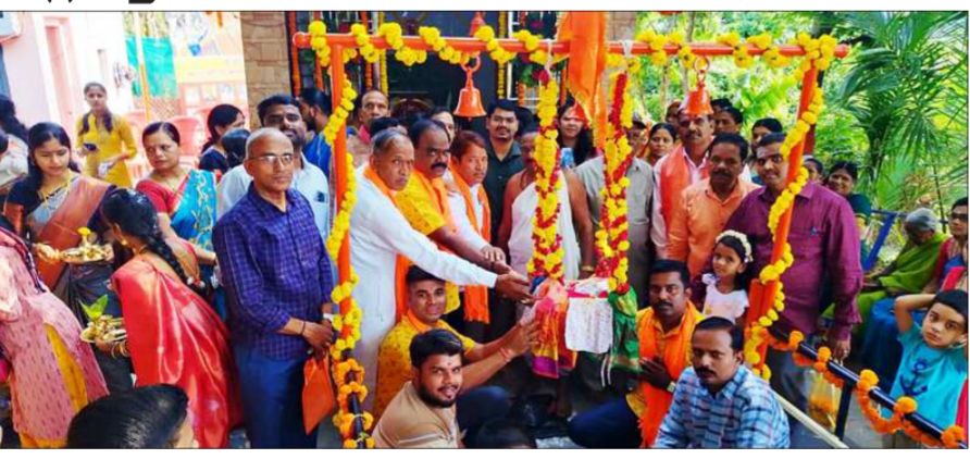
ಇಲ್ಲಿನ ರಾಮತೀರ್ಥ ನಗರ ರಹವಾಸಿಗಳಿಂದ ಕಣಬರಿಗೆ ಕೆರೆಯ ಪಕ್ಕದಲ್ಲಿರುವ ಶ್ರೀ ಹನುಮಾನ ಮಂದಿರದಲ್ಲಿ ಶ್ರದ್ಧಾ ಭಕ್ತಿಯಿಂದ ಹನುಮ ಜಯಂತಿಯನ್ನು ಬಹಳ ವಿಜೃಂಭಣೆಯಿಂದ ಆಚರಿಸಲಾಯಿತು.