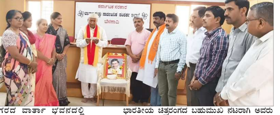
ಬೆಳಗಾವಿ, ಏ: ವರನಟ ಡಾ. ರಾಜಕುಮಾರ ಅವರು ಕೇವಲ ನಟ ಮಾತ್ರವಲ್ಲ, ಅವರು ಕನ್ನಡದ ಅಸ್ತಿ, ಸರಳ ಸಜ್ಜನಿಕೆಯ ವ್ಯಕ್ತಿ, ತಮ್ಮ ಪಾತ್ರಗಳ ಮೂಲಕ ಸಮಾಜಕ್ಕೆ ಉತ್ತಮ ಸಂದೇಶ ನೀಡಿದವರು.