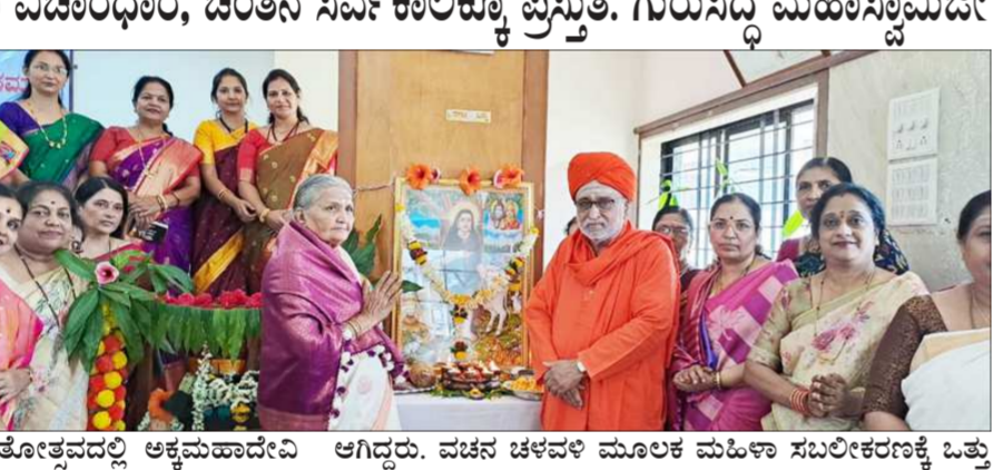
ಲಿಂಗಾಯತ ಮಹಿಳಾ ಸಮಾಜದ ದಿಂದ ಲಿಂಗಾಯತ ಭವನದಲ್ಲಿ ಶಿವಶರಣೆ ಅಕ್ಕಮಹಾದೇವಿ ಜಯಂತೋತ್ಸವದಲ್ಲಿ ಅಕ್ಕಮಹಾದೇವಿ ಭಾವಚಿತ್ರಕ್ಕೆ ಪುಷ್ಪಾರ್ಚನೆ ಸಲ್ಲಿಸಿ ದಿವ್ಯ ಸ್ನಾನ, ವಹಿಸಿ ಶ್ರೀಗಳ ಮಹಾಠಾಂಡದಲ್ಲಿ 12 ನೇ ಶತಮಾನದಲ್ಲಿ ಮಹಿಳಾ ಜಾಗೃತಿ ಮೂಡಿಸಿ ಸಾರ್ವತ್ರಿಕವಾಗಿ ಅಕ್ಕಮಹಾದೇವಿ ಚಳವಳಿಯ ನೆಲೆ ನೆನ್ನುವ, ಪತಿಯಿಂದ ನಂಬಿದರೂ ತಮ್ಮ ವೈರಾಗ್ಯದ ಮೂಲಕವೆ ಪುರುಷರೊಡನೆ ಸಮಾಲೋಚಾರಕ ಕಾರ್ಯದಲ್ಲಿ ಅಕ್ಕ ಮಹಾದೇವಿ ತೊಡಗಿದ್ದರು.